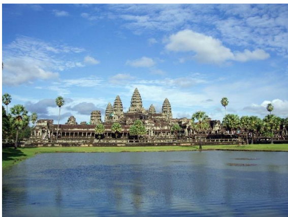
« Templo de Angkor Wat en Camboya » « Karta AngkorWat »