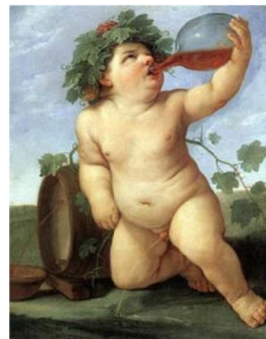
(Guido Reni, 1623)