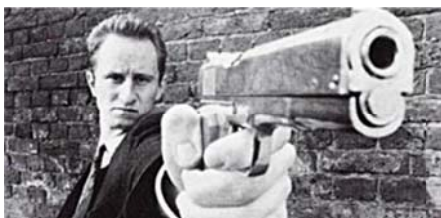
« Reviens gamin, c'était pour rire ! »

La maxime dit bien que les absents ont toujours tort et je garderai donc pour nous les meilleurs moments ! Pour les heureux spectateurs, je vous livre juste ces trois images, qu'eux seuls comprendront, en souvenir de ce moment digne d'une tragédie grecque !