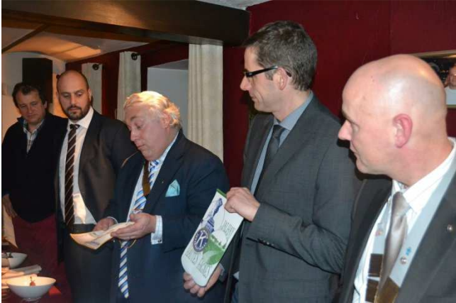
Réunion du 23 janvier 2014