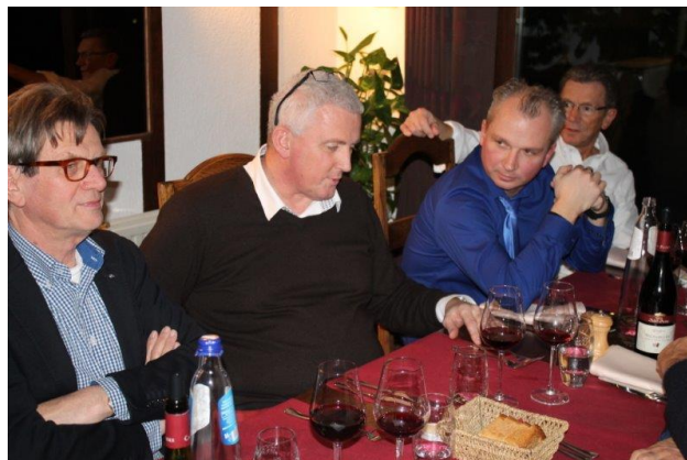
Réunion du 27 février 2014